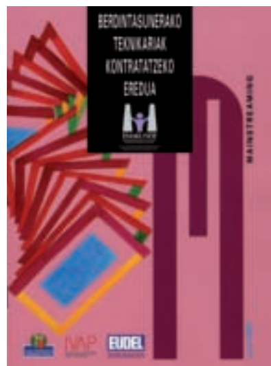
Portada de la publicación editada por Emakunde como guía para la contratación de personal técnico para la igualdad.