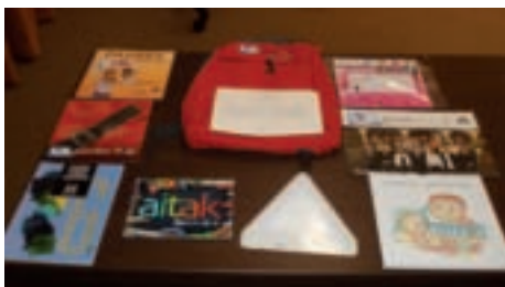
Materiales de la mochila Gizonduz.

Esta misma iniciativa también contempló la distribución de una mochila entre los hombres que vayan a ser padres. Los materiales incluidos en la mochila pretenden promover la participación igualitaria de los hombres en las tareas del cuidado y recordarles que deben asumir el “peso” de las responsabilidades y tareas que tradicionalmente les han sido impuestas a las mujeres. A finales de septiembre se realizó la primera entrega a través de las matronas y los órganos de las diputaciones forales competentes en materia de adopción. Todos los materiales están disponibles en formato pdf y pueden ser descargados en la dirección www.euskadi.net/gizonduz .