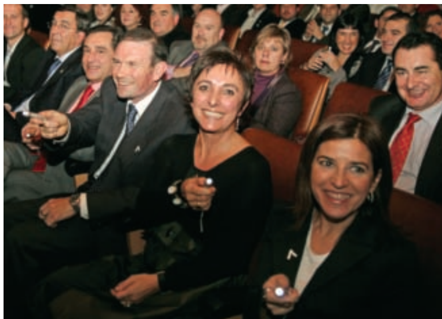
El lehendakari, la directora de Emakunde y la presidenta del Parlamento Vasco, entre el público asistente al acto, iluminan con linternas la imagen de un lazo blanco.

Se dirigió a las mujeres que han sufrido la violencia y se han rebelado ante ella como luchadoras por los derechos humanos y expresó su deseo de darles el protagonismo que se merecen.